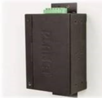
Wall mounting (Space saving)