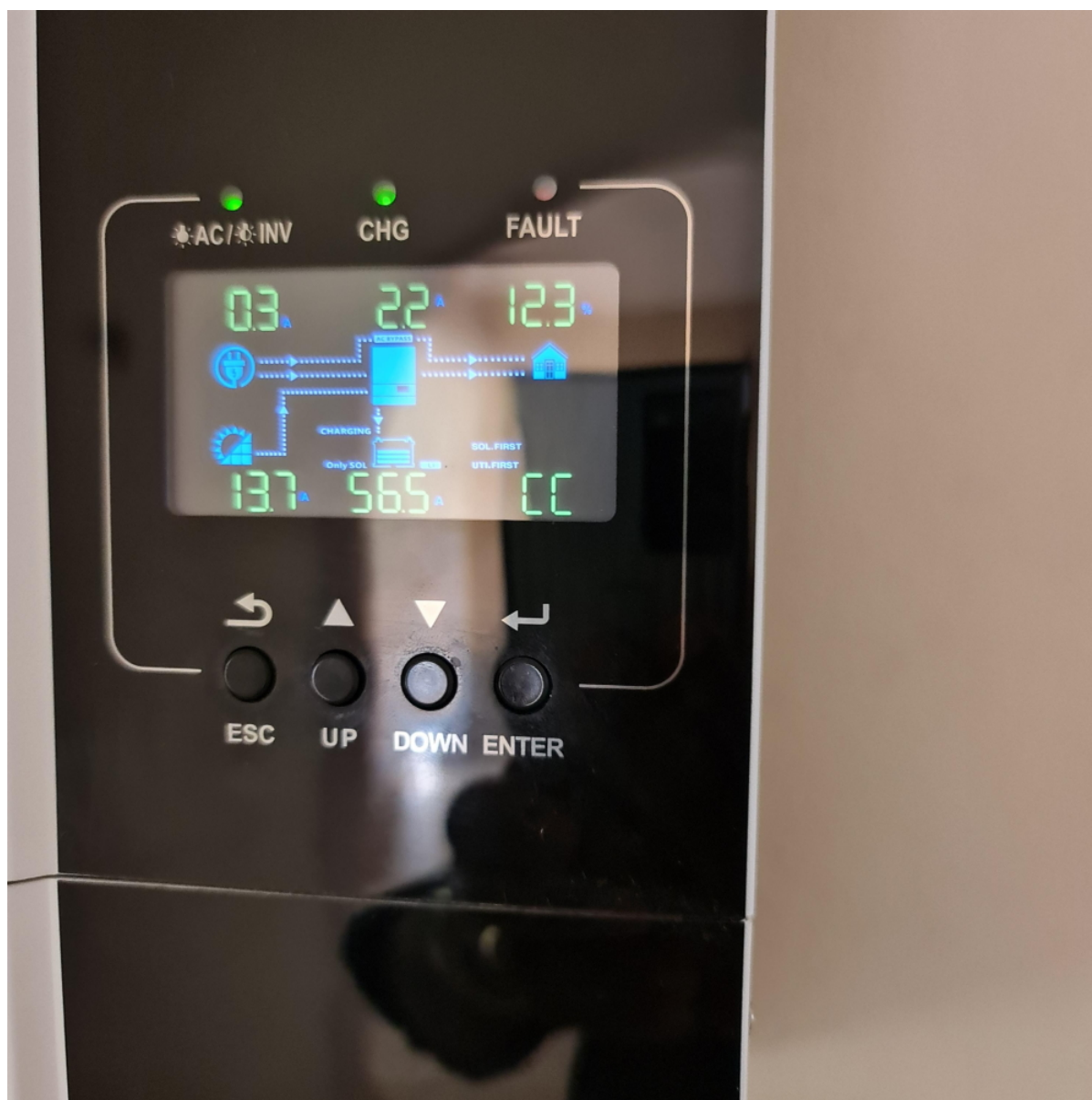
SPF 5000 ES verze (ilustrační foto)