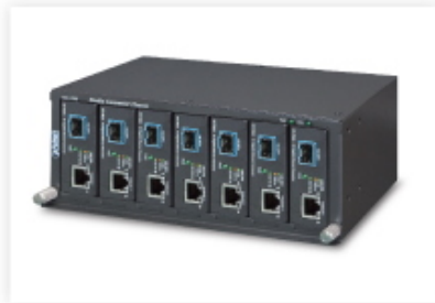
Media Chassis Installation