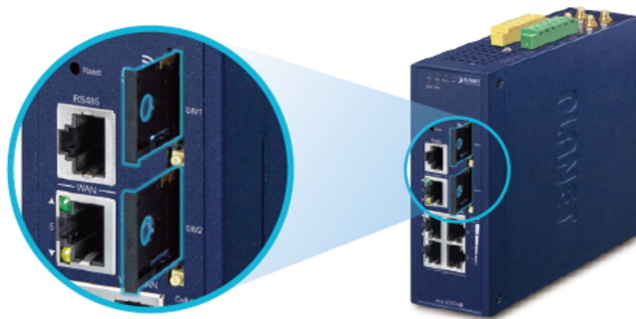
Dual 5G NR