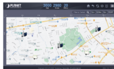
Centralized Management of IoT Devices