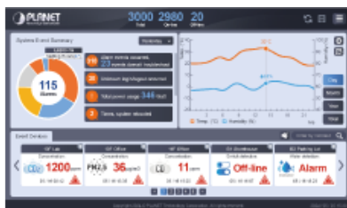
User-friendly Dashboard Design

Je vybaven centralizovaným inteligentním rozhraním pro správu, které je navrženo tak, aby bylo intuitivní a uživatelsky přívětivé. Toto rozhraní poskytuje komplexní ovládací panel, který nabízí monitorování a správu všech připojených zařízení IoT v reálném čase. Díky přehledným vizualizacím a snadno ovladatelným nabídkám mohou uživatelé rychle přistupovat k důležitým informacím, analyzovat data a přijímat informovaná rozhodnutí.