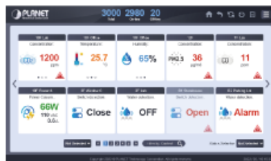
Complete Data Report